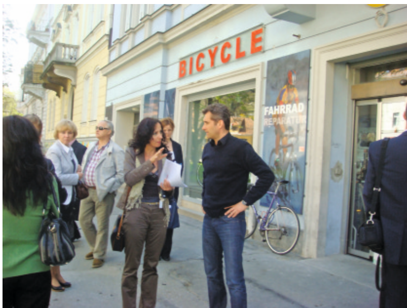
Przed siedzibą organizacji BICYCLE

W trakcie wymiany doświadczeń zaprezentowano nam jedną z organizacji zrzeszonych w projekcie Graz-jobs – BICYCLE . Oferuje ona pomoc osobom długotrwale bezrobotnym z Graz i okolicy w powrocie na rynek pracy. BICYCLE zajmuje się rozbudową infrastruktury ścieżek rowerowych, oferuje kompleksowe usługi w zakresie serwisu rowerowego, prowadzi sprzedaż rowerów. Osoby bezrobotne wybierając tą organizację jako miejsce praktyk i pracy, mają zatem szeroki wachlarz wyboru dziedziny, którą chciałyby się zajmować.