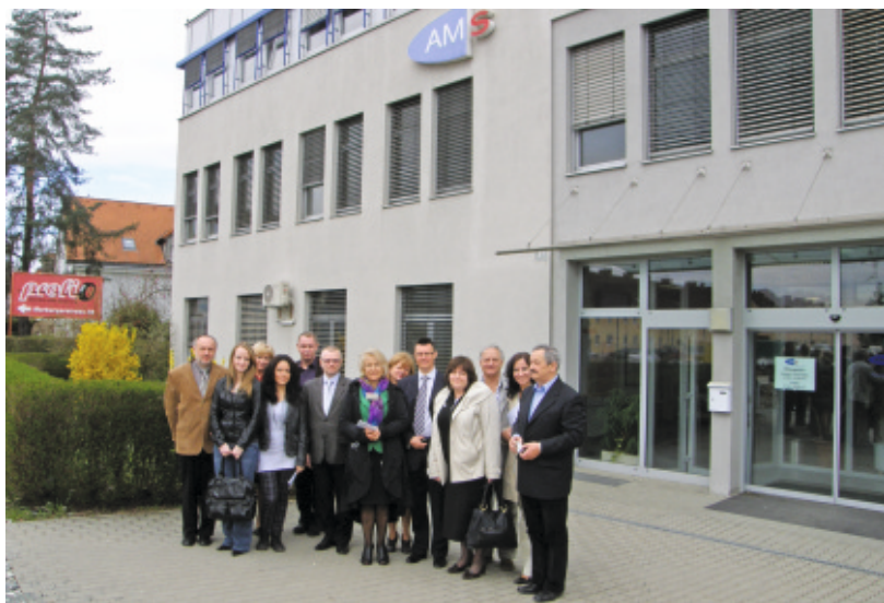
Uczestnicy projektu przed siedzibą AMS

W AMS działa również czwarty dodatkowy dział – Centrum Informacji Zawodowej. Osoby bezrobotne uczą się jak obsługiwać internet, a co za tym idzie, jak szukać pracy w sieci. Do dyspozycji są również pracownicy urzędu, którzy pomagają napisać CV czy też list motywacyjny. Co roku Centrum odwiedza ok. 12 000 osób (dane statystyczne AMS Leibnitz). Bardzo dużym ułatwieniem we współpracy z osobami bezrobotnymi jest specjalnie utworzona platforma internetowa, dzięki której pracownik urzędu może szybko i łatwo kontaktować się z daną osobą bezrobotną i przedstawić mu np. odpowiednie dla niej oferty pracy.