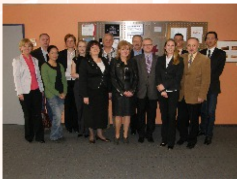
Wizyta w firmie szkoleniowej bit schulungscenter