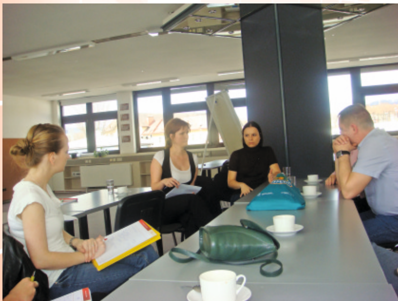
Wizyta w związku ERfA, rozmowa z koordynatorem projektu

Związek ERfA pełni rolę tzw. instytucji przejściowej. Oznacza to, iż pomaga osobom w szczególnej sytuacji w powrocie na rynek pracy, lecz nie gwarantuje stałej pracy, a jedynie zatrudnienie tymczasowe (tzw. praca dochodząca) w różnego typu zakładach pracy, współpracujących z ERfA.