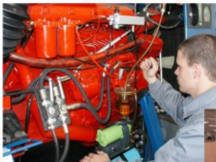
Uczniowie w trakcie zajęć

samochodowych, elektryk pojazdów samochodowych lub zawód podwójny – mechanik i elektryk pojazdów samochodowych. W zależności od wybranego zawodu nauka trwa od 3 do 4 lat. Szkoła dysponuje ogromnym zapleczem – 22 sale do nauki teoretycznej, 11 sal laboratoryjnych, 17 warsztatów. Oprócz praktycznej nauki zawodu w szkole, uczniowie mają również praktyki w zakładach pracy. Szkoła zawodowa w Arnfels cieszy się dużą renomą wśród lokalnych przedsiębiorców, dlatego też prowadzony jest co roku konkurs dla najlepszych uczniów – nagrodą jest zatrudnienie w jednym z warsztatów pracy.